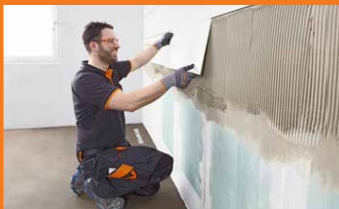
Pose en toute tranquillité et en ménageant ses efforts.