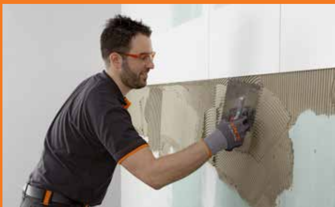
De lichte vulstoffen zorgen ervoor dat het aanbrengen flexibeler en eenvoudiger is dan ooit tevoren.

Tegelen zonder krachtinspanning met de nieuwe PCI Nanolight. De lichte variabele flexmortel zorgt voor gewichtloosheid op de bouwplaats. Dankzij de verbeterde kwaliteit is deze alleskunner nu nog flexibeler, nog steviger en met een nog langere correctietijd te verwerken. Ook grote, zware tegels kunnen moeiteloos zonder wegglijden op de wand worden aangebracht, zonder stress tot ca. 15 minuten na het aanbrengen worden gecorrigeerd. PCI Nanolight is de universele ster in het PCI-universum. Geschikt voor alle ondergronden en alle keramische materialen.